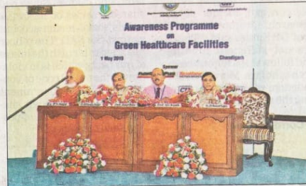
At the seminar, hospital engineers, administrators, doctors and architects highlighted various aspects of green healthcare

rector of PGI, said that the institute had become the first government hospital to be conferred with star ratings by the Bureau of Energy Efficiency in 2014.